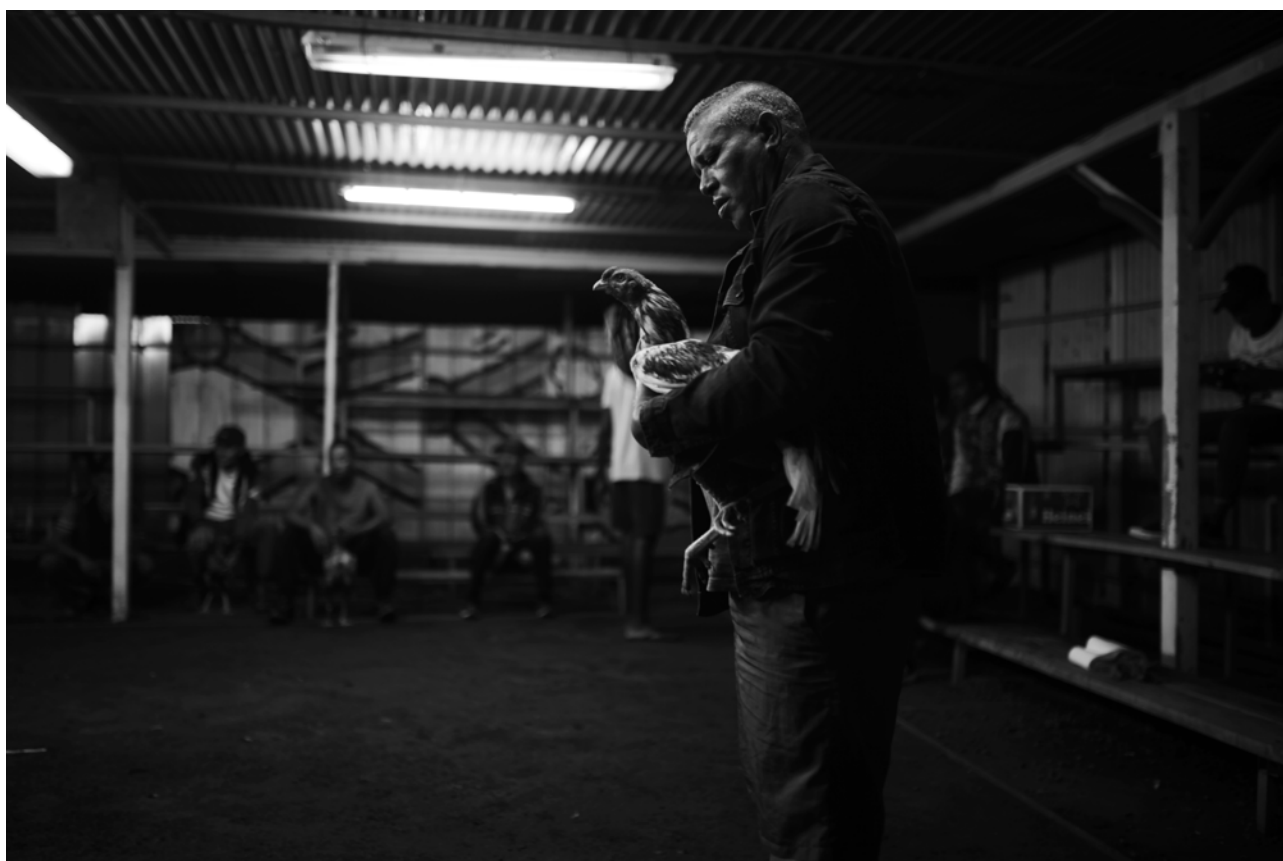
© Andrew Tshabangu, Long Road, 2018. Courtesy of the artist

Sur la possibilité d'espoir et l'avenir comme promesse